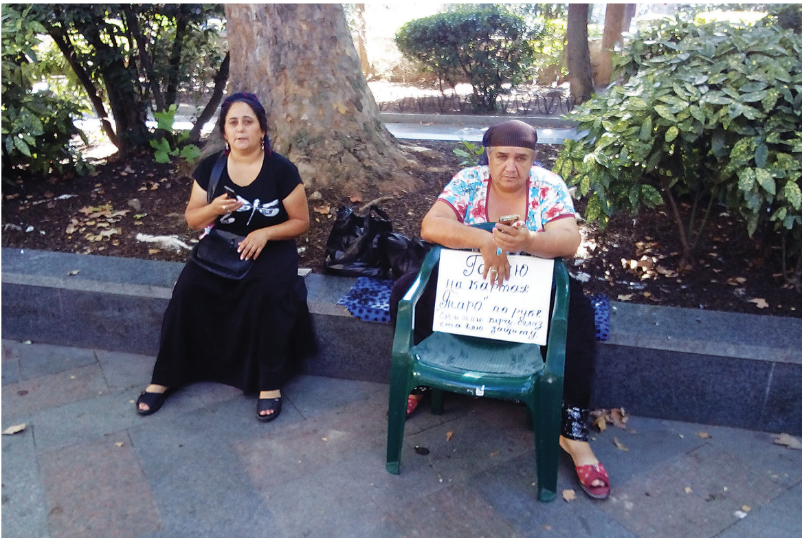
На Пушкинской улице уже много лет ведётся незаконная предпринимательская деятельность по гаданиям и другим важным в цифровой век оккультным услугам. Ау, Ливадийский отдел полиции!