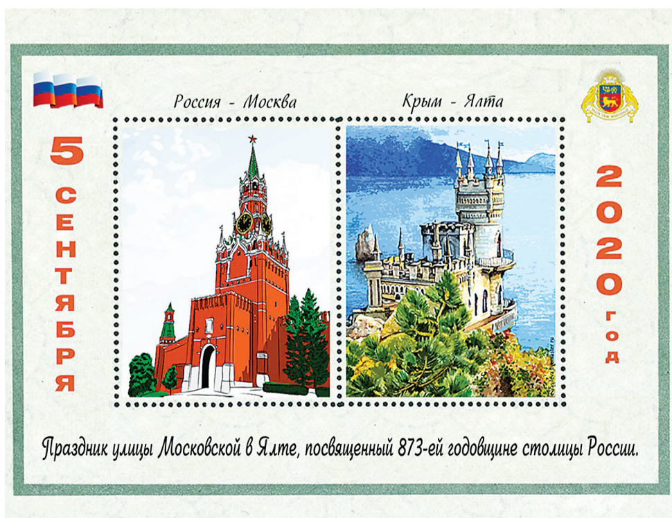
Московский художник Артур Церих специально для Ялты создал почтовую марку.