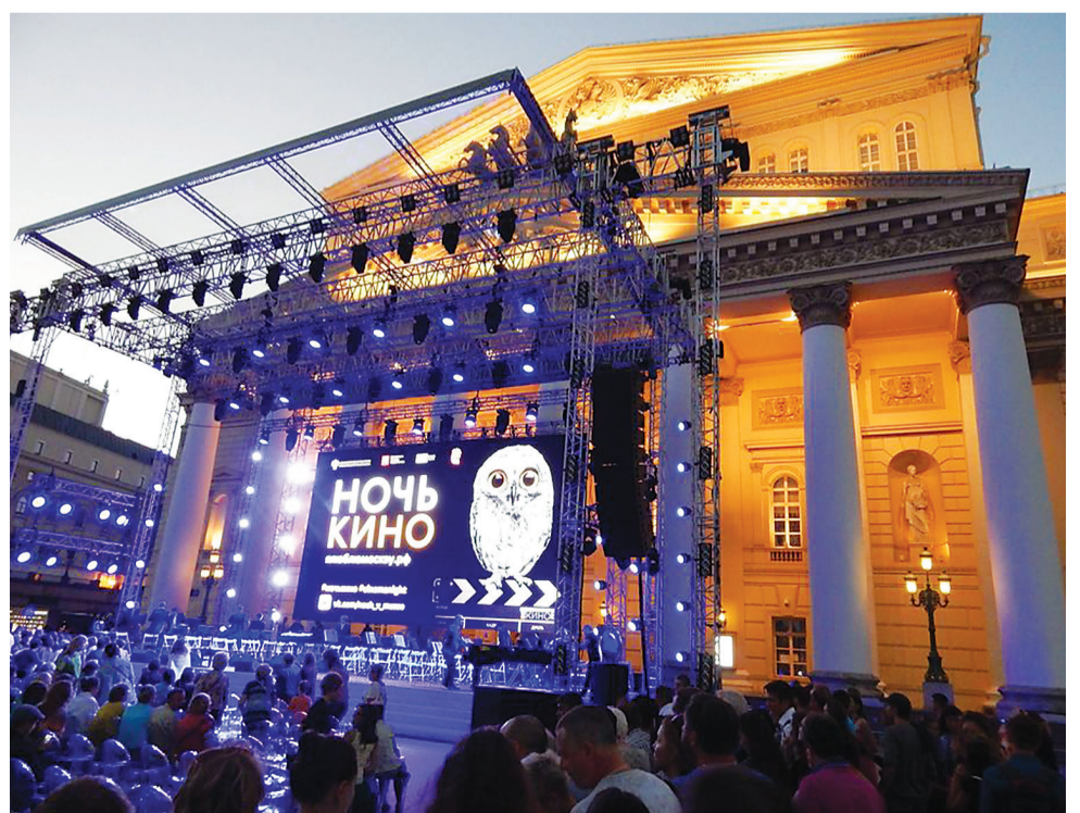
Стало доброй традицией проводить Ночь кино у Большого театра.