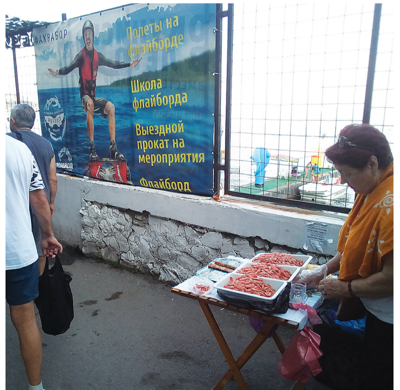
При входе на Массандровский пляж всё лето продавались креветки с рук. Не связано ли с коррупцией плохое зрение сотрудников департаментов муниципального контроля и торговли?