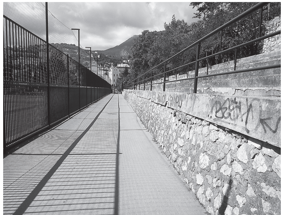
В январе торжественно открыли реконструированный стадион ДЮЦФЦ, но забыли отремонтировать ...трибуны. Не догадались и поставить будку сторожа на въезде.