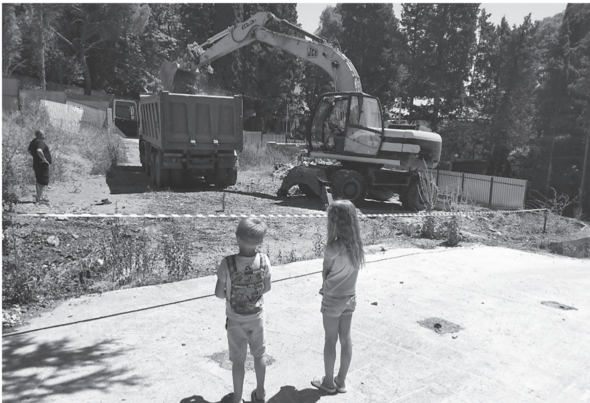
Из-за нарушения элементарных правил строительства (отсутствие забора по всему периметру участка!) в любой момент могут пострадать и дети, и взрослые.