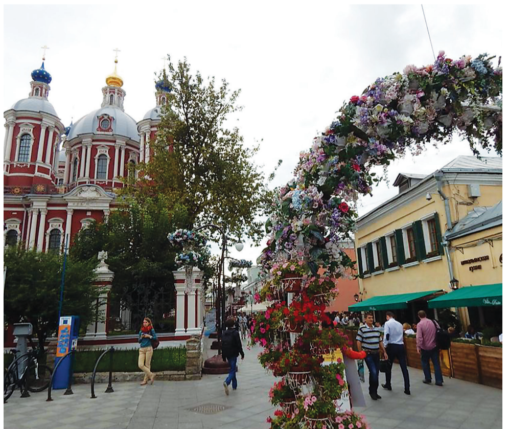
Замоскворечье удивляет своей изысканностью, а вот стоянки для велосипедов в Москве есть повсюду.