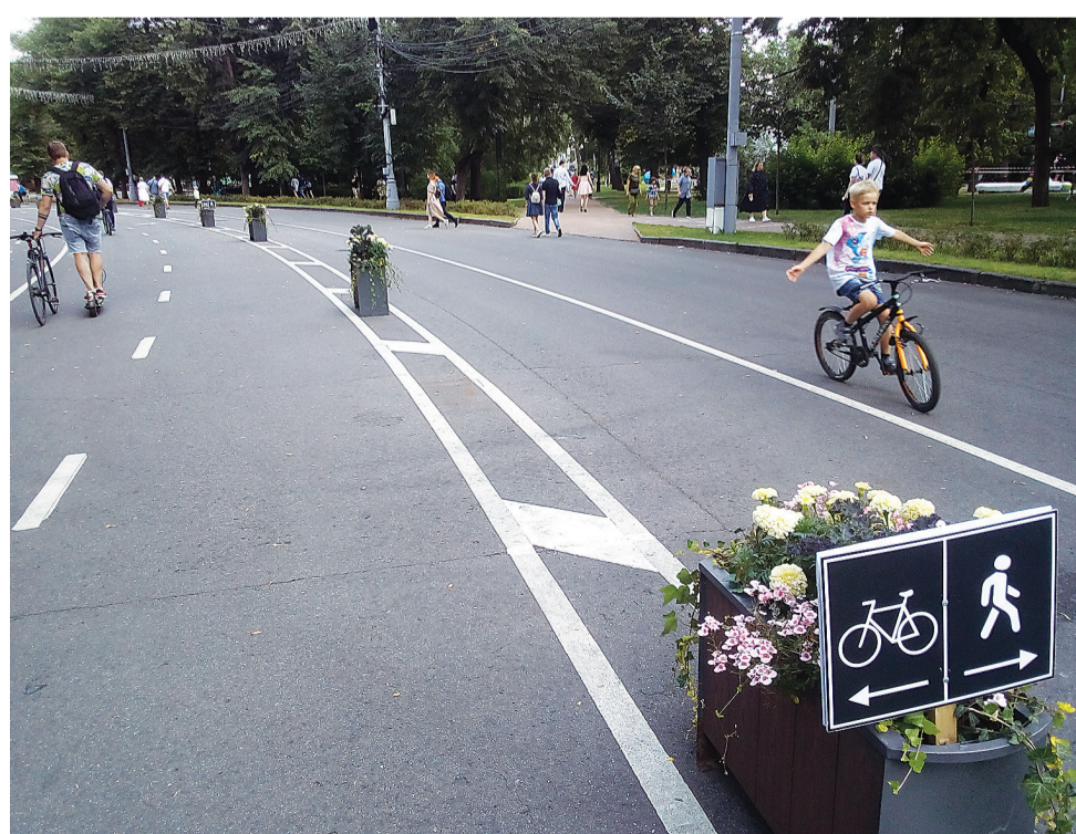
В Сокольниках очень много цветов и специально выделенных дорожек для велосипедистов. Замечательный парк советского детства и современных развлечений!