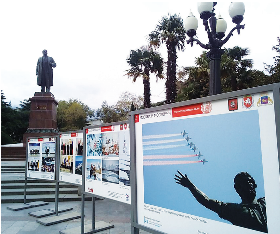
На вернисаже в Ялте: снимок воздушной части Парада Победы на Красной площади