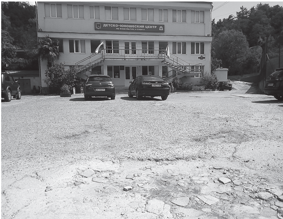
Сегодня как символ беспорядка лежит разбитый асфальт перед построенным в советское время зданием ДЮСШ. Рядом — давно неработающие туалеты.