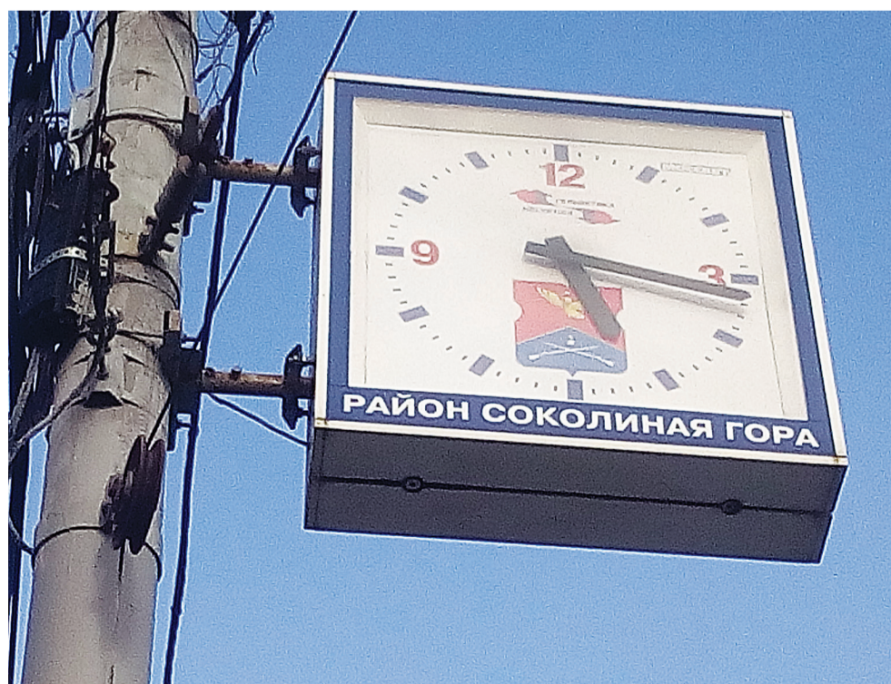
Вот такие фирменные уличные часы на территории управы Соколиная Гора, с которой Ялту связывают побратимские отношения.