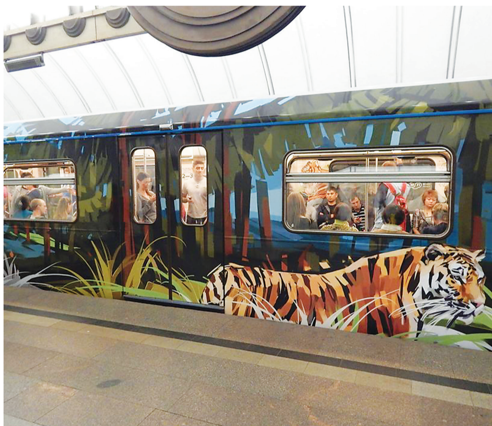
В московском метро ходит состав «Полосатый рейс», посвящённый амурским тиграм и дальневосточным леопардам.