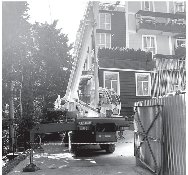
Строительная техника периодически полностью блокирует выход людей из соседнего жилого дома. а на улице Щорса теперь постоянные пробки, т.к. подрядчик не согласовал с ГИБДД схему движения автотранспорта.