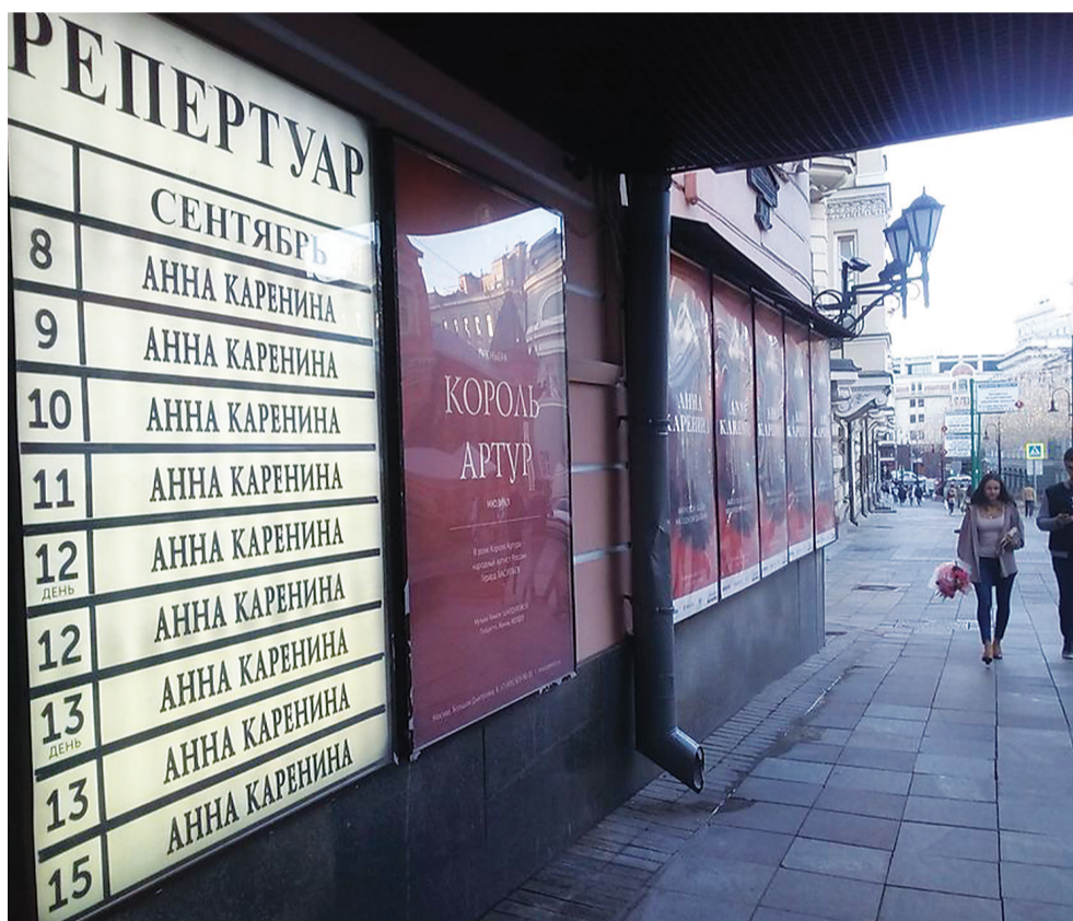
Непобедима страна, в которой такой спектакль ежедневно с аншлагом показывают в московском театре оперетты!