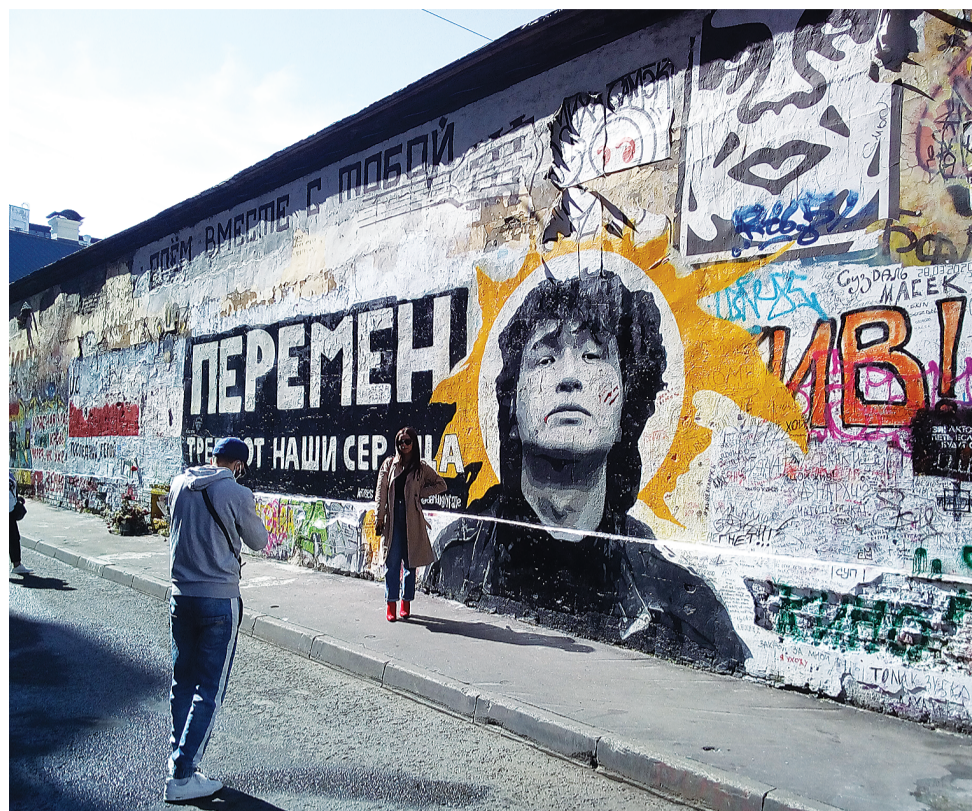
На Арбате есть стена Виктора Цоя. Ялтинцы помнят его по съёмкам в культовом фильме «Асса» Сергея Соловьёва.