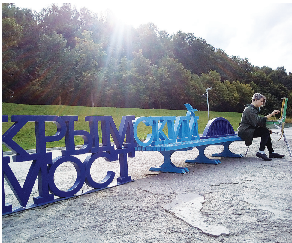
Лавочки с Крымским мостом украшают набережную Москвы-реки.