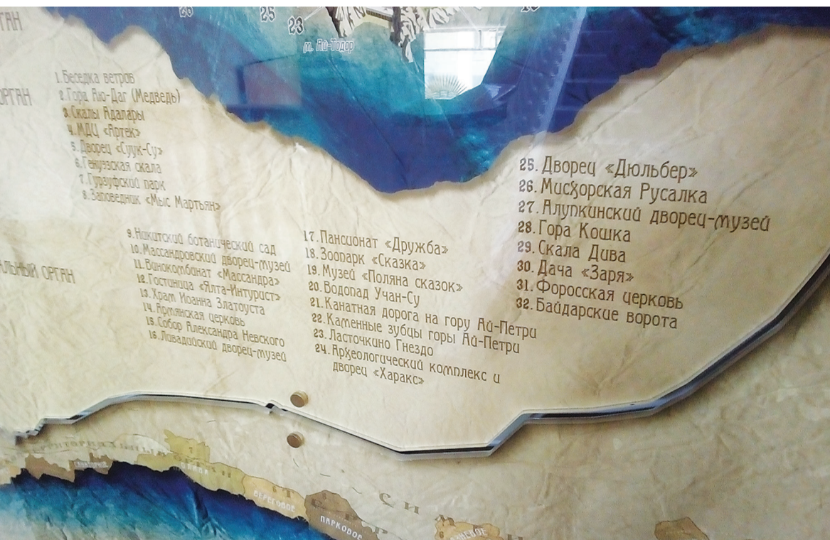
На 2-ом этаже здания администрации Ялты малограмотный сити-менеджер Челтанов установил карту достопримечательностей ЮБК, не включив в неё Дом-музей А.П.Чехова. Увы, ставшая зимой руководителем аппарата Романец также проигнорировала просьбы ялтинцев исправить ошибку: