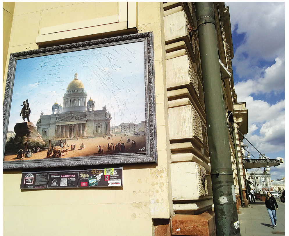
В центре российской столицы можно увидеть репродукции картин великих художников прямо на фасадах домов